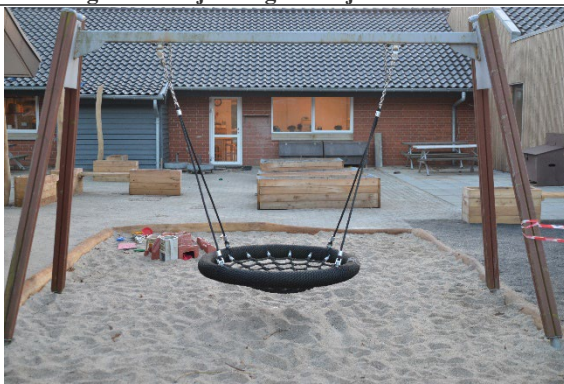
Redskab: Fugleredegynge Årgang: Producent: Er redskabet mærket: Nej Er der registreret fejl/mangler: Ja