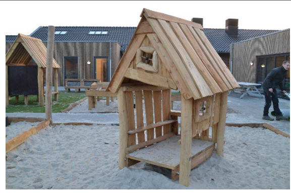
Redskab: Legehus Årgang: 2022 Producent: Nikoplay Er redskabet mærket: Ja Er der registreret fejl/mangler: Nej