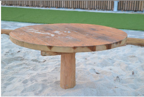
Redskab: Sandbord Årgang: 2022 Producent: Nikoplay Er redskabet mærket: Ja Er der registreret fejl/mangler: Nej