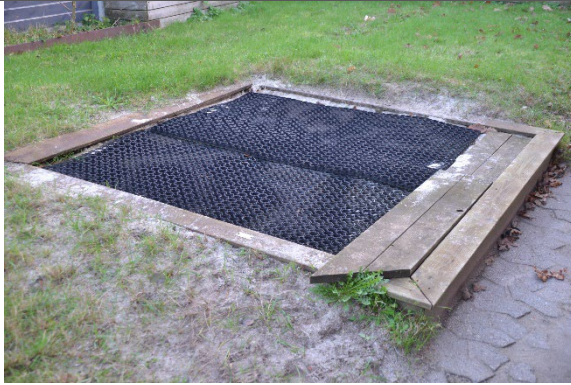
Redskab: Sandkasse Årgang: Producent: Er redskabet mærket: Ja, men ulæseligt Er der registreret fejl/mangler: Nej