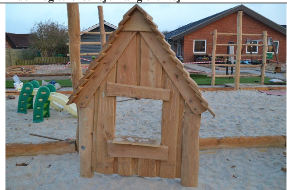
Redskab: Facade Årgang: 2022 Producent: Nikoplay Er redskabet mærket: Ja Er der registreret fejl/mangler: Nej