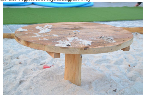
Redskab: Sandbord Årgang: 2022 Producent: Nikoplay Er redskabet mærket: Ja Er der registreret fejl/mangler: Nej