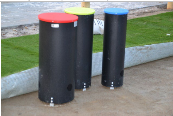
Redskab: Musikinstrument Årgang: 2022 Producent: kbtmusik Er redskabet mærket: Ja Er der registreret fejl/mangler: Nej