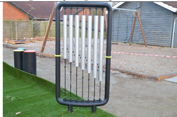
Redskab: Musikinstrument Årgang: 2022 Producent: kbtmusik Er redskabet mærket: Ja Er der registreret fejl/mangler: Nej