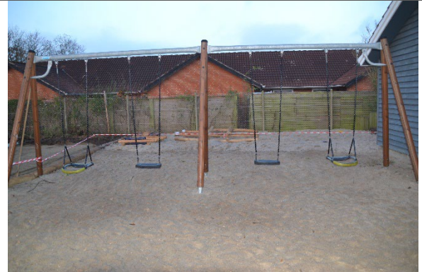
Redskab: Gyngestativ Årgang: 2019 Producent: Hag Er redskabet mærket: Ja Er der registreret fejl/mangler: Nej