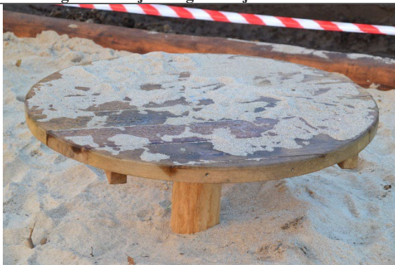
Redskab: Sandbord Årgang: 2022 Producent: Nikoplay Er redskabet mærket: Ja Er der registreret fejl/mangler: Nej