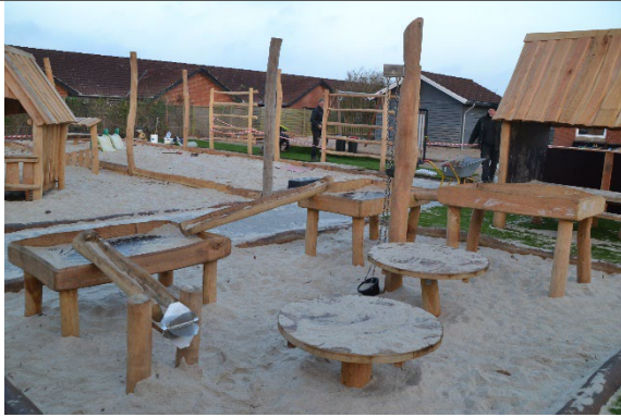
Redskab: Vandleg Årgang: 2022 Producent: Nikoplay Er redskabet mærket: Ja Er der registreret fejl/mangler: Nej