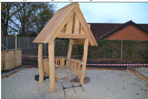
Redskab: Legehus Årgang: 2022 Producent: Nikoplay Er redskabet mærket: Ja Er der registreret fejl/mangler: Nej