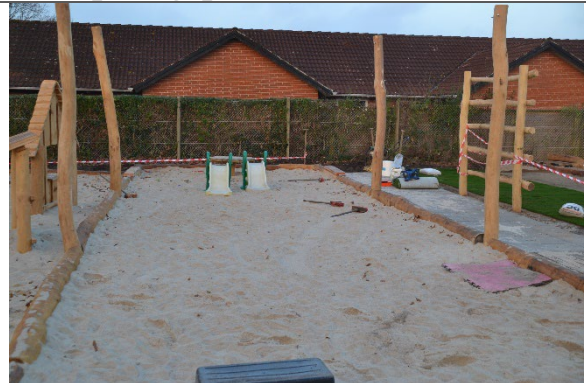
Redskab: Sandkasse Årgang: 2022 Producent: Nikoplay Er redskabet mærket: Ja Er der registreret fejl/mangler: Nej