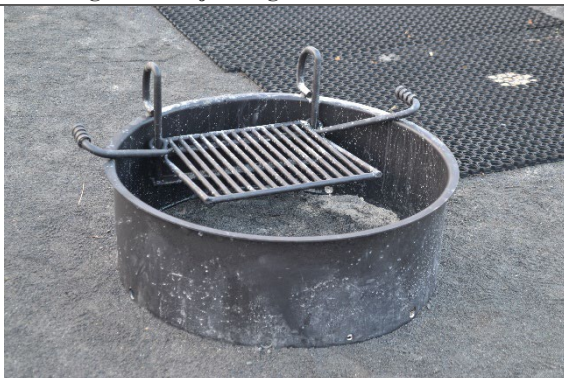
Redskab: Bålsted Ikke omfattet af DS/EN 1176