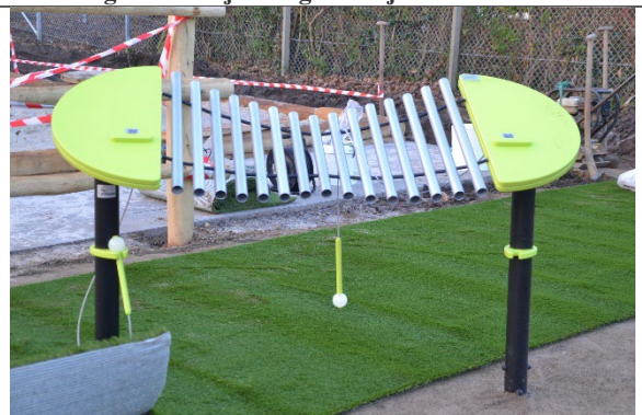
Redskab: Musikinstrument Årgang: 2022 Producent: kbtmusik Er redskabet mærket: Ja Er der registreret fejl/mangler: Nej