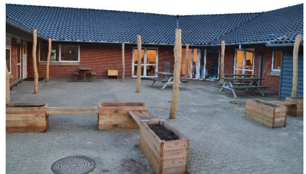
Redskab: Stolper til læsejl Årgang: 2021 Producent: Guldborg Er redskabet mærket: Ja Er der registreret fejl/mangler: Nej