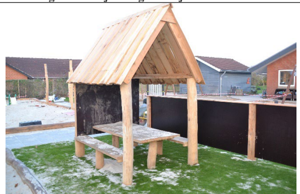
Redskab: Madpakkehus/legehus Årgang: 2022 Producent: Blåbjerg Trampolin Er redskabet mærket: Ja Er der registreret fejl/mangler: Nej