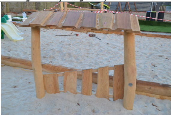
Redskab: Facade Årgang: 2022 Producent: Nikoplay Er redskabet mærket: Ja Er der registreret fejl/mangler: Nej